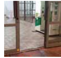
生協から食堂に向かう通路には低い段差があります。