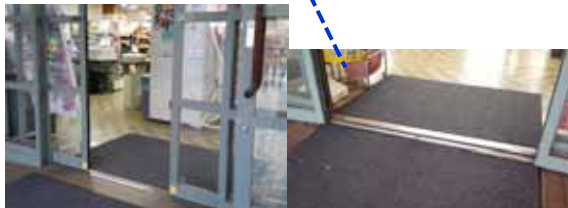
入り口は、左側が段差無しの自動ドアで右側は少し段差のある手動ドアです。