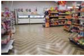
比較的広い通路です。