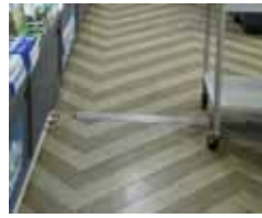
建物の段差はありませんが、時折コードによる段があります。