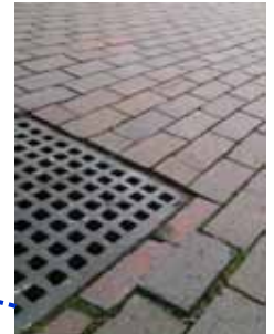
段差がある所があります。