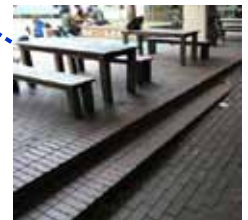
学生広場の端に段差があります。