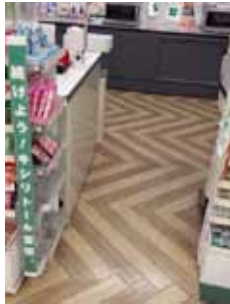
中央のレジのみ少し通路が狭いです。