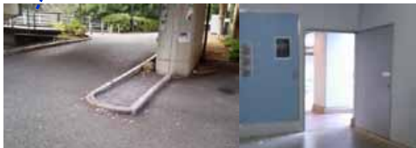
生協・食堂に向かう通路は、段差はありませんがゆるやかな傾斜があります。

注：2015年10月～12月の期間に調査しました。その後工事等により状況が変わっている場合があります。この資料をもとに事故等が起こっても責任は負いかねます。各自の責任でご使用ください。