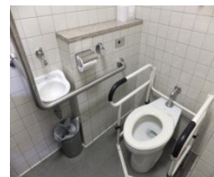
建物入口のすぐ近くに 車椅子用のトイレがあり ます。入口幅が84cmな ので、若干狭く感 じますが、一人でも 利用可能です。本部棟 には車椅子用のトイレ はここだけです。