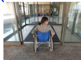
入口の中央は自動ドアで、 幅が164cmあるので、車 椅子で容易に通ること ができます。左右には 手動ドアもありますが、 車椅子での通行は困 難です。

注:2011年10月~11月の期間に調査しました。その後工事等により状況が変わっている場合があります。 この資料をもとに事故等が起こっても責任は負いかねます。各自の責任でご使用ください。