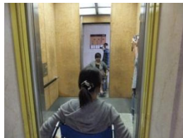
エレベータ(入口幅90cm) には鏡が付いており、一人 での乗り降りが可能です。