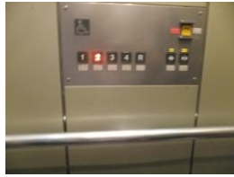
エレベータ(入口幅90cm)には車椅子用ボタンや手すりが付いています。