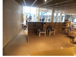
スロープの傾斜は8度で、電動か介助が必要です。