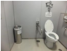
車椅子用トイレがあります。入口幅約90cm