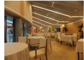
レストランの机の高さはちょうどよいです。混雑時でなければ、奥にも容易に移動可能です。

注:2011年10月~11月の期間に調査しました。その後工事等により状況が変わっている場合があります。この資料をもとに事故等が起こっても責任は負いかねます。各自の責任でご使用ください。