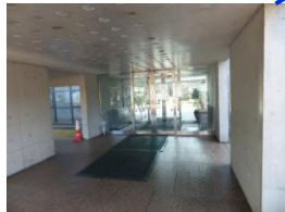
入口は十分な広さの自動ドアです。