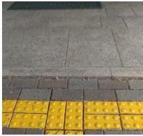
入口前には3~4cmの段差があります。