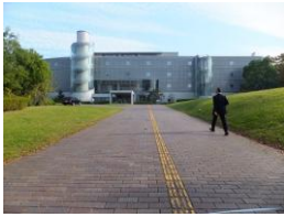
入口までは傾斜約3度です。