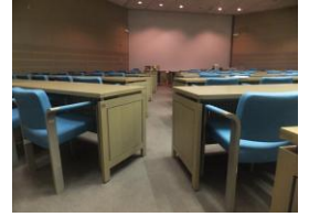
移動しにくい机のため、前方への移動には介助が必要です。