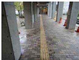
入口まで点字ブロックがあります。