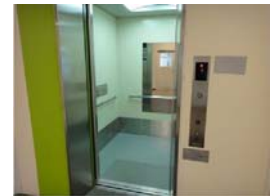
車椅子用エレベータがあります。