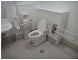
車椅子用トイレがあります。