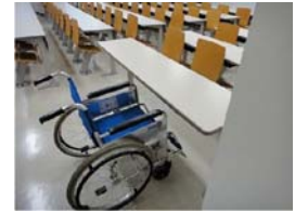
教室には車椅子用の机があります。