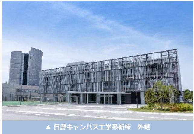
▲ 日野キャンパス工学系新棟 外観

東京都立大学では2023年10月、日野キャンパスの工学系新棟に、 産学公連携スペース「TMU Innovation Hub」 を開設します。本スペースを拠点として、本学の研究成果や研究機器共用センターなどのリソースを活用したスタートアップ創出や大学発スタートアップの支援を行います。さらに、多摩地域の大学・研究機関、自治体、金融機関、企業等の多様な機関と連携協力してスタートアップ・エコシステムを構築することにより、イノベーション創出を促進させ、多摩地域の振興に貢献していきます。