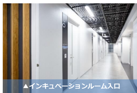
▲インキュベーションルーム入口