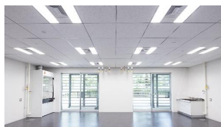
▲インキュベーションルームA・B