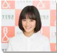
ゲスト: 大友花恋 (女優・ファッションモデル)