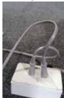
延長コードがあります