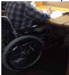
閲覧席は車いすでも利用可能な高さです。