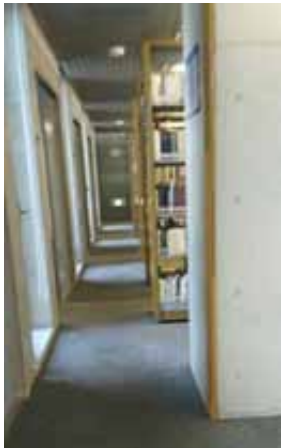
通路は狭い箇所もありますが、車いすで通行可能です。