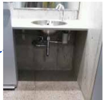
2,3階に洗面台があります。車いすでも利用しやすい高さです。