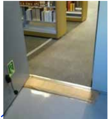
階段室の出口は手動ドアです。少し段差があります。