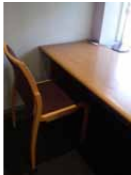
個室の閲覧室です。