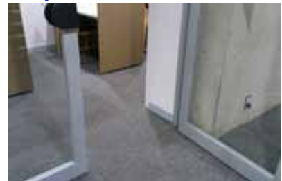
キャレルへの入口は手動ドアです。段差は全くありません。

注：2015年10月～12月の期間に調査しました。その後工事等により状況が変わっている場合があります。この資料をもとに事故等が起こっても責任は負いかねます。各自の責任でご使用ください。