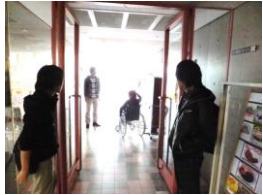
正面入口の横幅140cmです。段差はありません