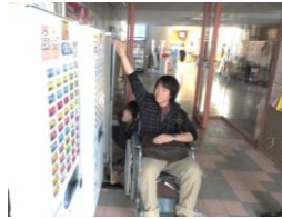
食券販売機の高さは160cmです。