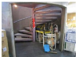
らせん階段の横幅は134cmで、段差は20cmです。エレベータはありません。