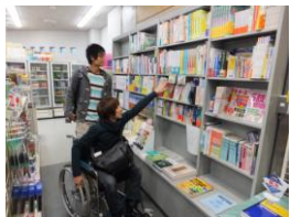
混雑時でなければ一巡できる幅があります。