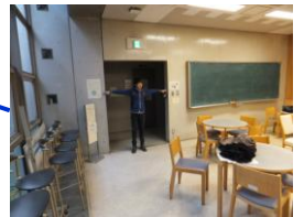
可動のイスと机があります。

注: 2011年10月~11月の期間に調査しました。その後工事等により状況が変わっている場合があります。この資料をもとに事故等が起こっても責任は負いかねます。各自の責任でご使用ください。