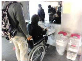
手洗い場の高さは72cmです。