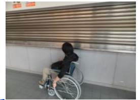
カウンターの高さは100cmです。

こちらの入口は横幅122cm、段差6cmです。降りる(出る)のは可能ですが、介助があった方が良いでしょう。