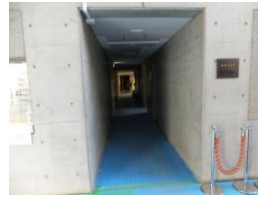
廊下の横幅は161cmです。