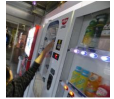
自動販売機があります。車いす用のボタンはありません。