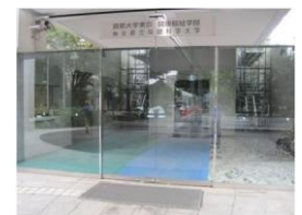
入口は自動ドアで、車椅子2台分以上の幅(178cm)があります。段差はありません。

注:2011年10月~11月の期間に調査しました。その後工事等により状況が変わっている場合があります。この資料をもとに事故等が起こっても責任は負いかねます。各自の責任でご使用ください。