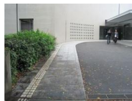
緩やかな上り坂(傾斜3~5度)です。点字ブロック付きの歩道(幅200cm)があります。歩道と車道には段差が3cmあります。