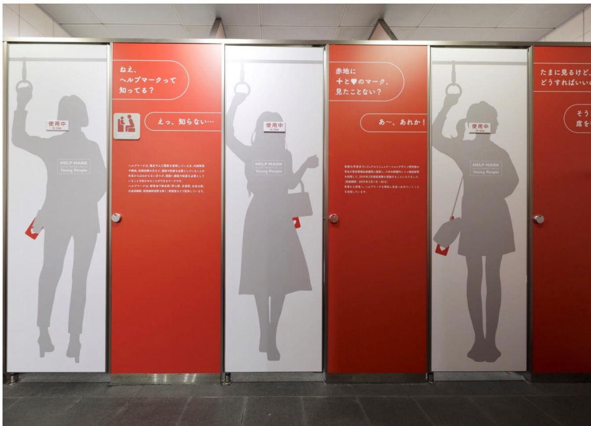
撮影 ナカサ&パートナーズ